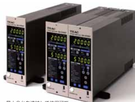
最大8台を連結して使用可能

ブリッジ電源・オートバランス・校正電圧・ローパスフィルタ・ハイパスフィルタなど、ひずみ計測・電圧測定に必要な基本機能を装備し、最大5,000倍の感度と、DC~150kHzの広帯域周波数特性を持っています。