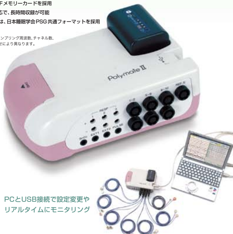
PCとUSB接続で設定変更やリアルタイムにモニタリング